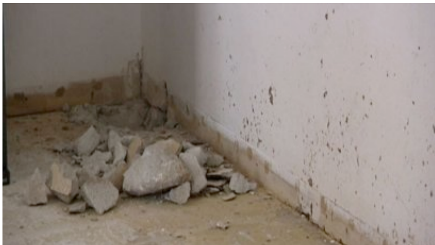
Po zalaniu urwał się sufit